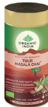
Tulsi Masala Chai Tin Aromático & Sabroso

Una mezcla llena de vida a granel a base de Tulsi, Jengibre y Citronela