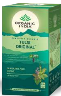
Tulsi Original Aromático & Divino

Una mezcla exótica a base de Tulsi, Té negro y especias