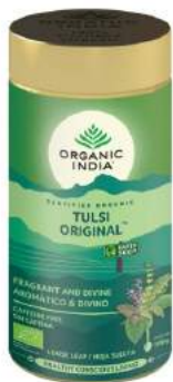
Tulsi Original Tin Aromático & Divino

Reduce el estrés · Ayuda a la digestión · Apoya el sistema inmune · Anti-aging · Abundante en antioxidantes · Equilibra el metabolismo · Fortalece la estamina · Equilibra los niveles de energía · Poderoso adaptógeno · Levanta el ánimo