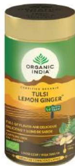
Tulsi Lemon Ginger Tin Delicioso & lleno de sabor

Una mezcla perfecta a granel de tres variedades de Tulsi: Rama, Vana y Krishna