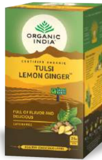
Tulsi Lemon Ginger Deliciosa & Lleno de sabor

Una mezcla perfecta de tres variedades de Tulsi: Rama, Vana y Krishna