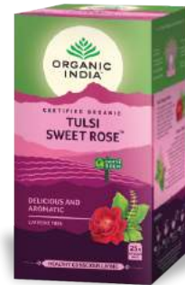
Tulsi Sweet Rose Deliciosa & Aromática

Una mezcla llena de vida a base de Tulsi, Jengibre y Citronela